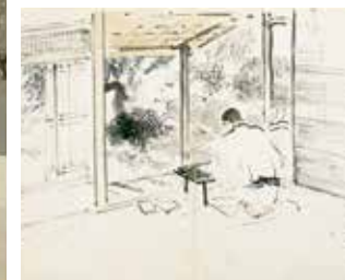
Kanazawa Enikki Journal illustré de Kanazawa (détail) (1923)