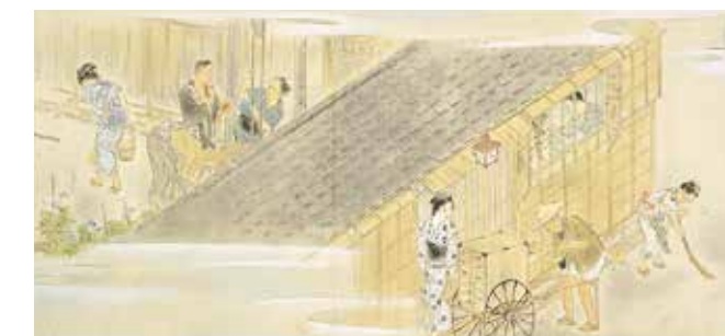
Choseki Ankyo / Matin; Vie du petit peuple du centre ville durant la période Meiji (détail) (1948)