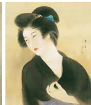
Eri Oshiroi / Maquillage du décolleté à la poudre (1924)