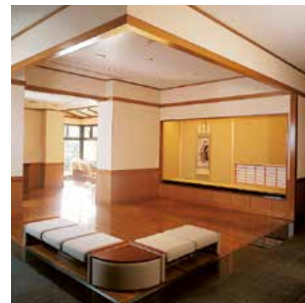
Grande salle, lieu de repos

Kaburaki ayant beaucoup apprécié l'atelier que l'architecte Isoya Yoshida (également un de ses amis proches) lui construisit dans le quartier de Yaraicho, situé dans le district Ushigome de Tokyo, il en fit créer une réplique au premier étage de sa maison à Yukinoshita. L'exposition du musée recrée l'atelier de Kaburaki tel qu'il était en 1954 lors de sa construction, en utilisant des matériaux d'époque.