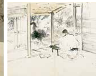
Kanazawa Enikki Journal illustré de Kanazawa (détail) (1923)