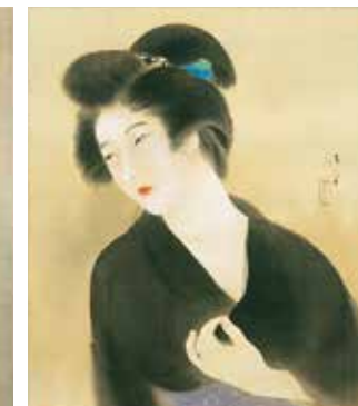
Eri Oshiroi / Maquillage du décolleté à la poudre (1924)