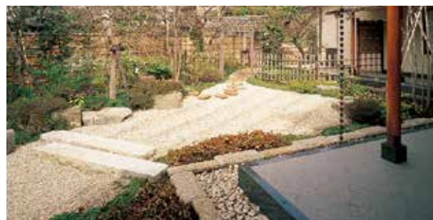
Cour avec jardin