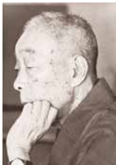
Les dernières années de Kiyokata Kaburaki, vu ici dans sa maison de Yukinoshita, Kamakura