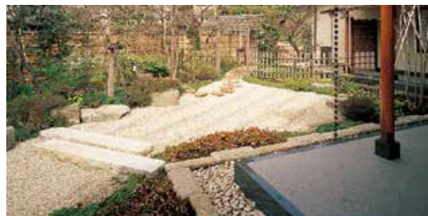
Cour avec jardin