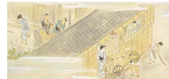
Choseki Ankyo / Matin; Vie du petit peuple du centre ville durant la période Meiji (détail) (1948)