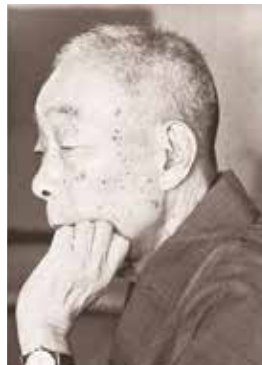
말년의 가부라키 기요카타 가마쿠라 유키노시타의 자택에서 촬영 가타야마 세츠소우