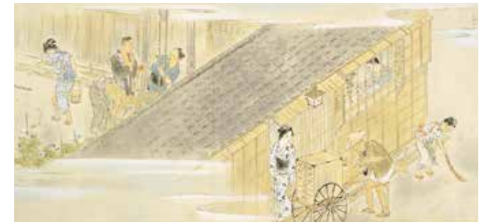
편안한 나날 아침(부분) 1948년