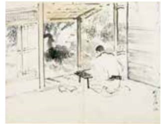
가나자와 그림일기(부분) 1923년