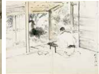
가나자와 그림일기(부분) 1923년