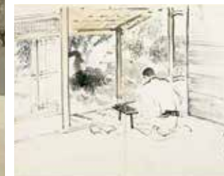
Kanazawa Enikki Diario ilustrado de Kanazawa (detalle) (1923)