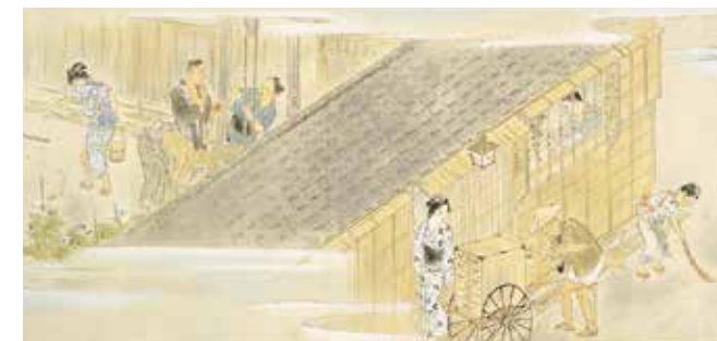
Choseki Ankyo / Mañana; Vida de la gente común en las calles del centro durante el periodo Meiji (detalle) (1948)