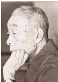
Kiyokata Kaburaki en sus últimos años, en su hogar, en Yukinoshita, Kamakura