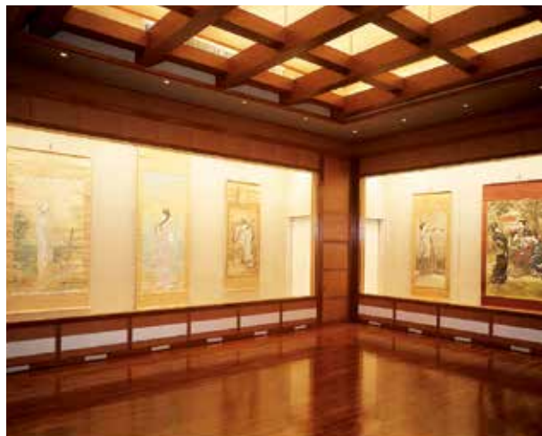
Sala de exhibición