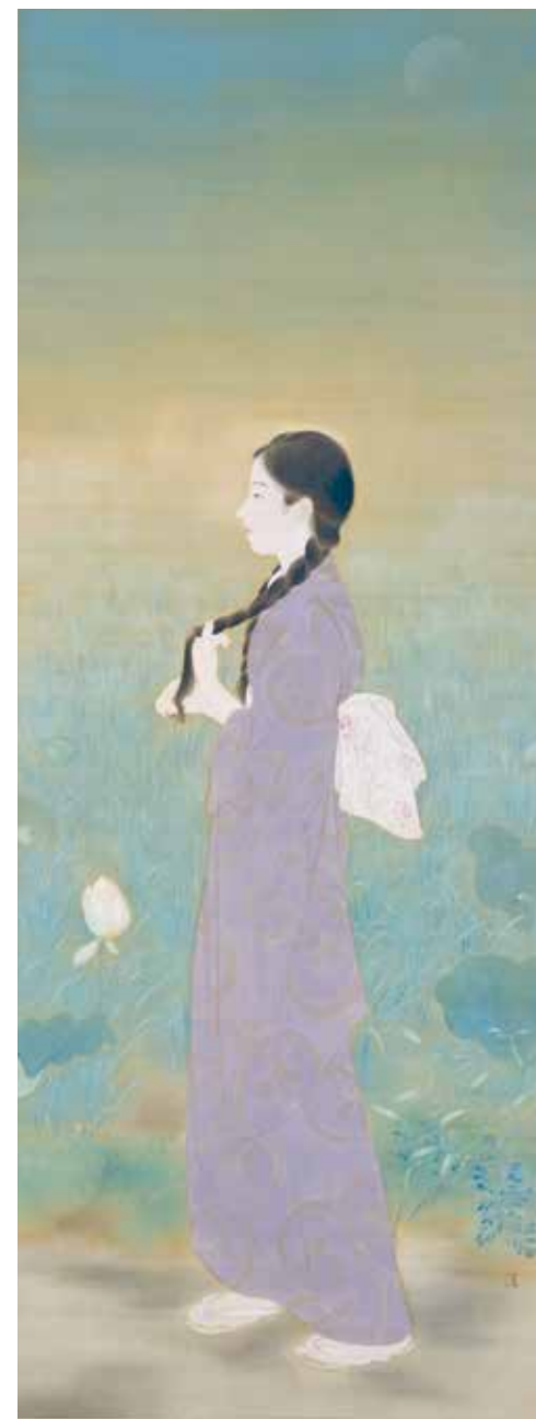
Asasuzu /Frio de la mañana (1925)