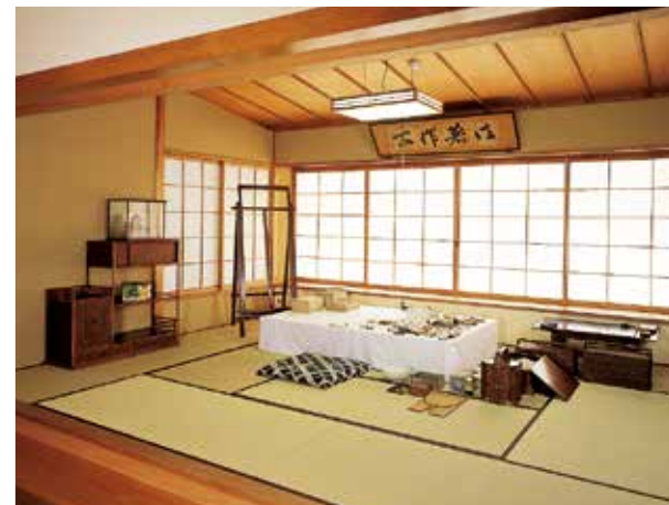
Estudio de arte

Como le gustó el estudio de arte construido para él en el barrio Yaraicho del distrito Ushigome de Tokio por el arquitecto Isoya Yoshida, quien también era un amigo cercano suyo, Kaburaki se hizo construir un estudio idéntico en la segunda planta de su hogar, aquí en Yukinoshita. La exhibición del museo recrea el estudio de arte de Kaburaki como se veía cuando se construyó en 1954, con materiales originales de la época.