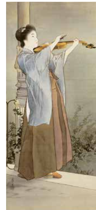
Shusyo / Tarde de otoño (1903)