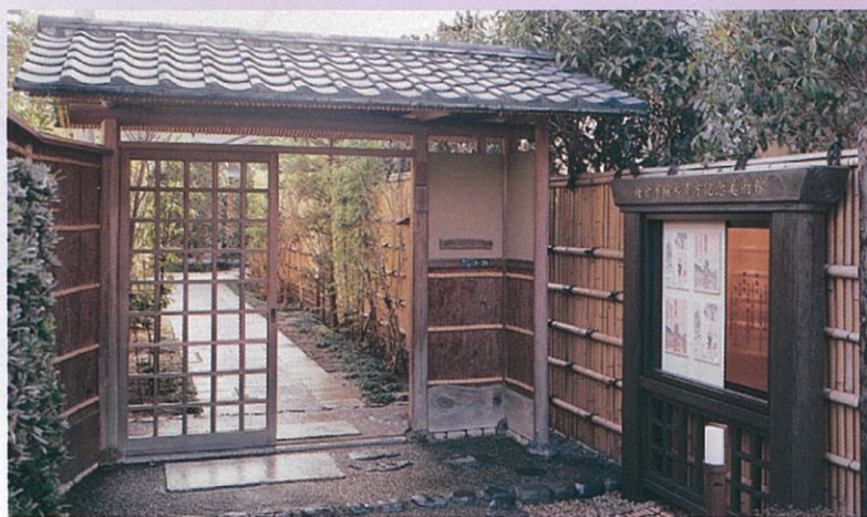
鎌倉市鏑木清方記念美術館 50円引き