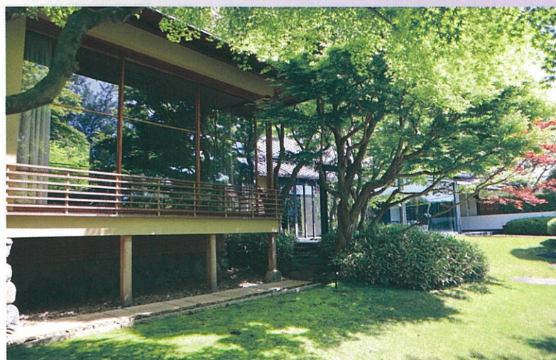
山口蓬春記念館 100円引き