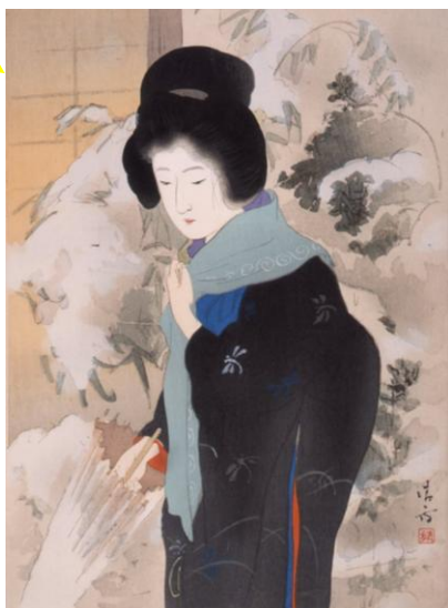
菊池幽芳著『小ゆき』後編 木版口絵 大正4年(1915)