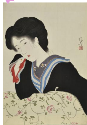
渡辺霞亭著『勝鬨』中編 木版口絵 大正4年(1915)