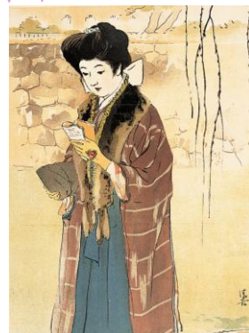
虎の門 見立十二姿の内 石版口絵 明治43年(1910)