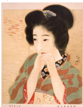
歌留多会の夜 『婦人公論』口絵 大正5年(1916)