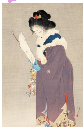
春を待つ 『文芸倶楽部』木版口絵 明治37年(1904)